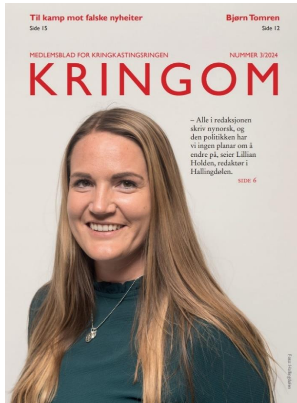
Kringom nr. 3/2024