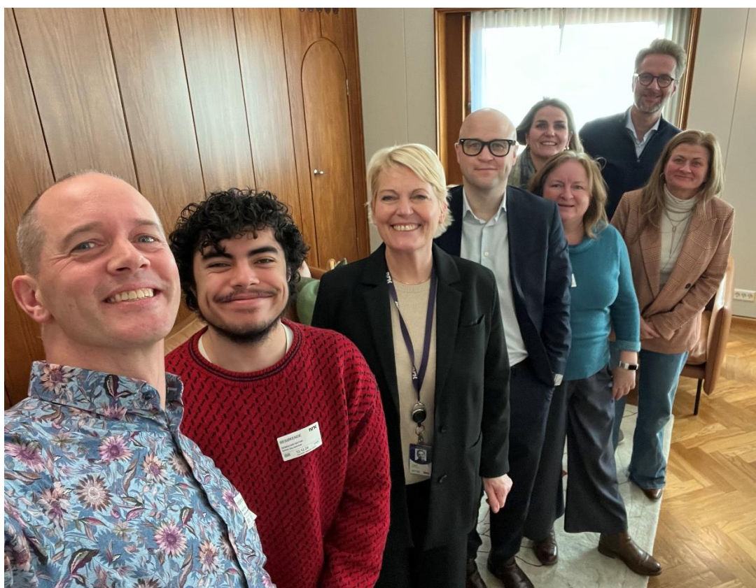
Møte mellom NRK-leinga og Kringkastingsringen, Noregs Mållag og Norsk Målungdom, des. 2024.