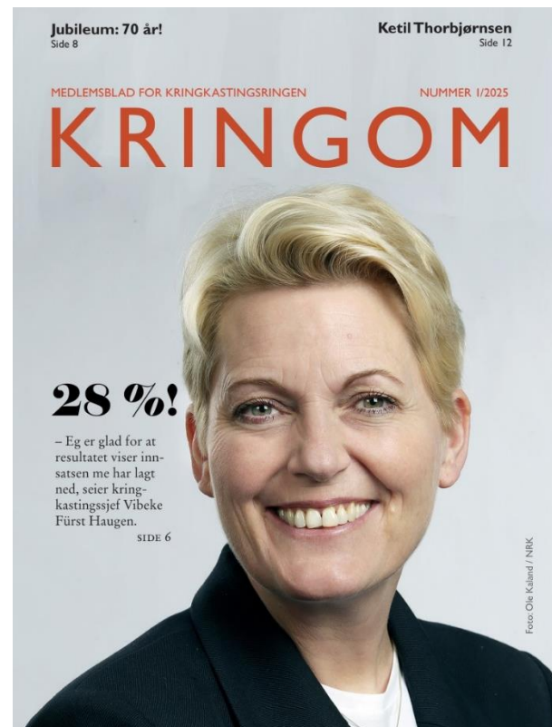
Kringom nr. 1/2025