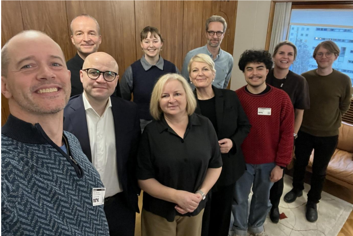
Møte mellom NRK-leinga og Kringkastingsringen, Noregs Mållag og Norsk Målungdom, des. 2025.