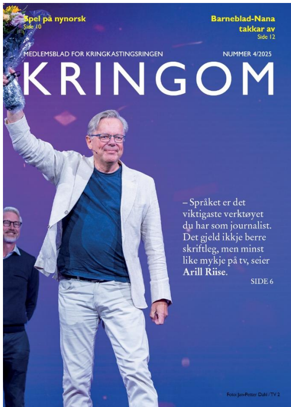
Kringom nr. 4/2025