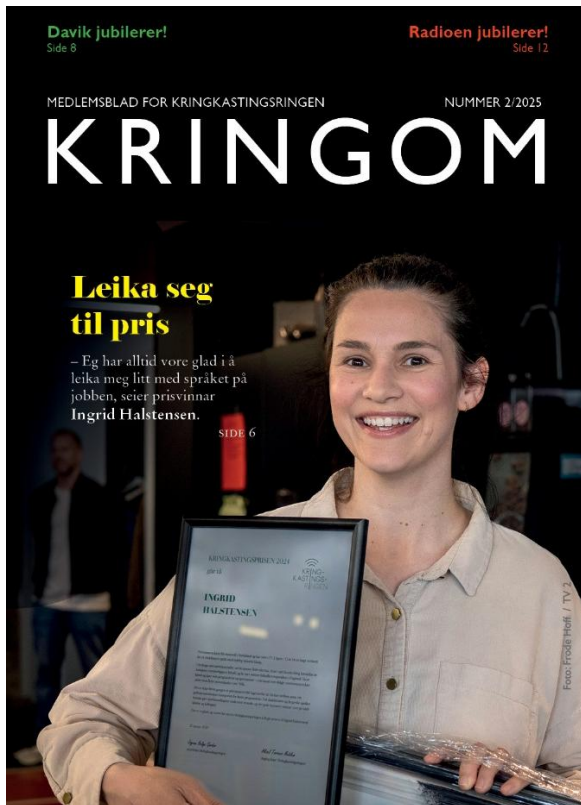
Kringom nr. 2/2025